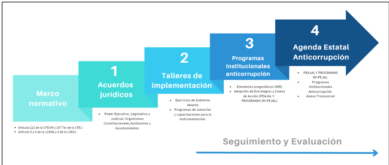
Gráfico 2. Ruta Integral de Implementación de la PEAJAL