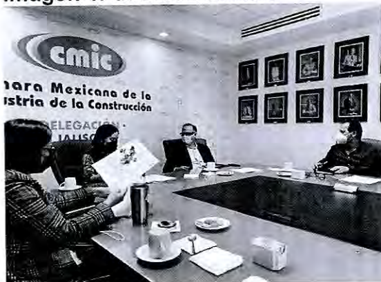
Imagen 1. Sala de Reunión