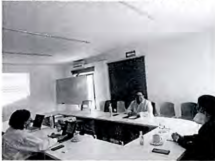
Imagen 1. Sala de Reunión.

El día 25 de marzo de 2022 se llevó a cabo una reunión de trabajo entre personal de la Dirección de Coordinación Interinstitucional de la Secretaría Ejecutiva del Sistema Estatal Anticorrupción del Estado de Jalisco y miembros de la Cámara Mexicana de la Industria de la Construcción Delegación Jalisco, en torno al Convenio de Colaboración que ambos entes suscriben, a través de la plataforma Zoom.